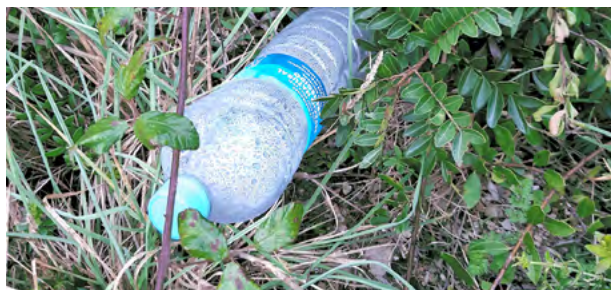
© Marta Pérez López | Plastic Free Menorca