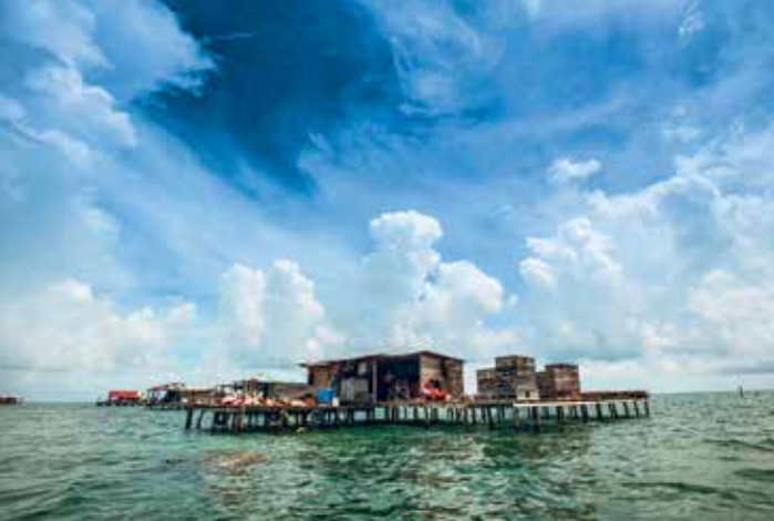
Reserva Biológica Marina Cayos Miskitos y Franja Costera. RACCN, Nicaragua, 2014.