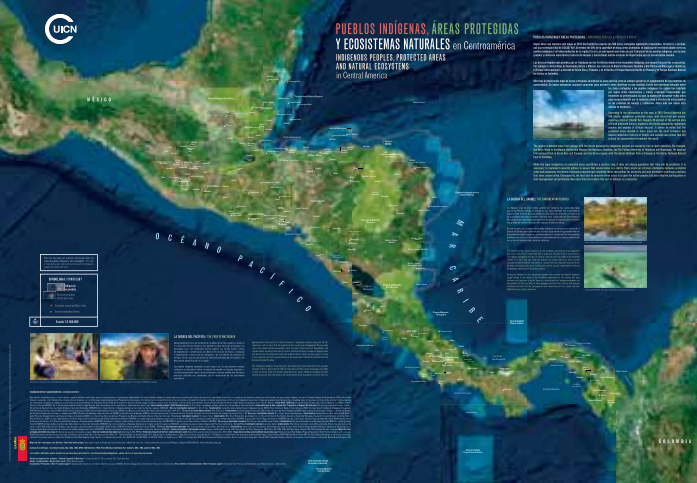
Cara B: Mapa de pueblos indígenas, áreas protegidas y ecosistemas naturales en Centroamérica