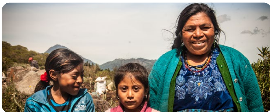
Familia en San Marcos, Guatemala.