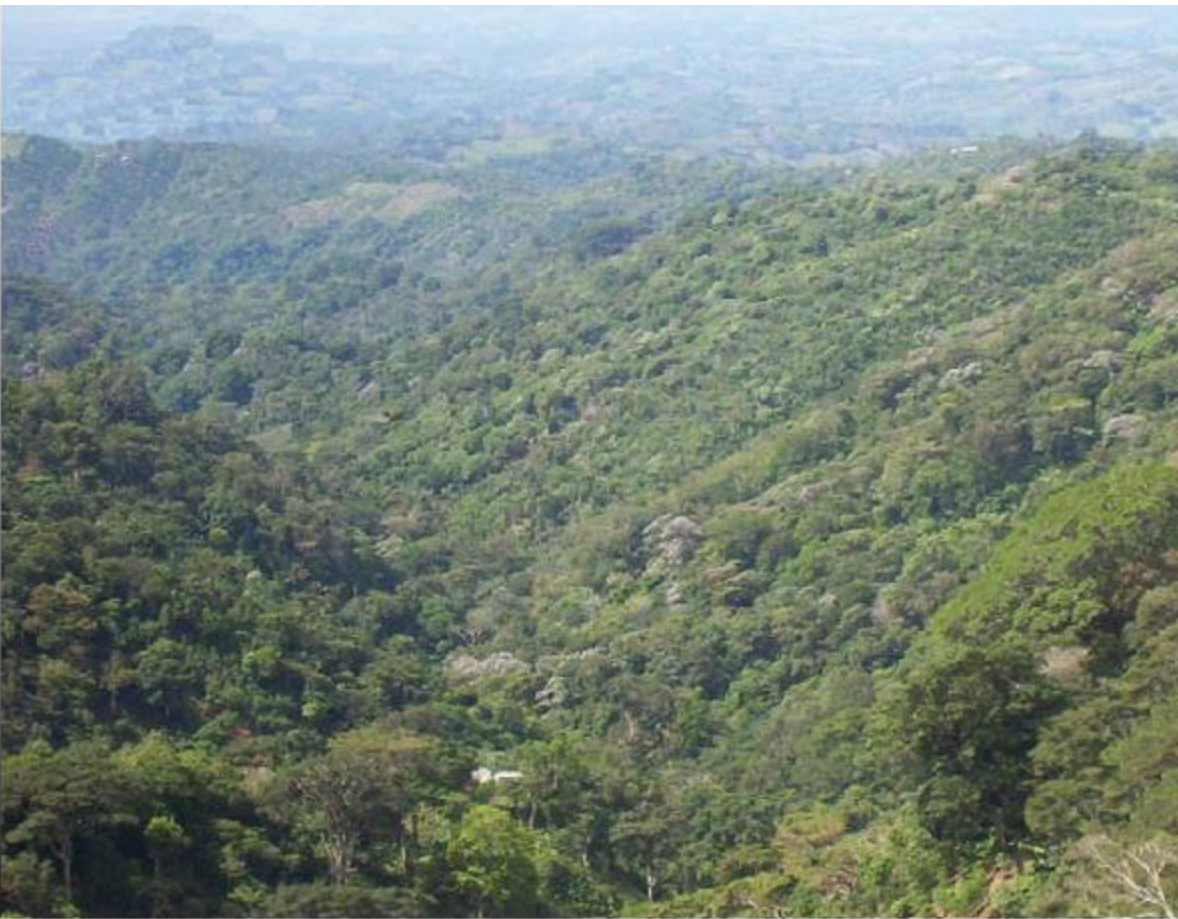
Panorámica de una cuenca cubierta por café en el municipio de Jujutla, departamento de Ahuachapán

Las plantaciones de café con sombra también favorecen la circulación del agua y la infiltración de la misma en los acuíferos