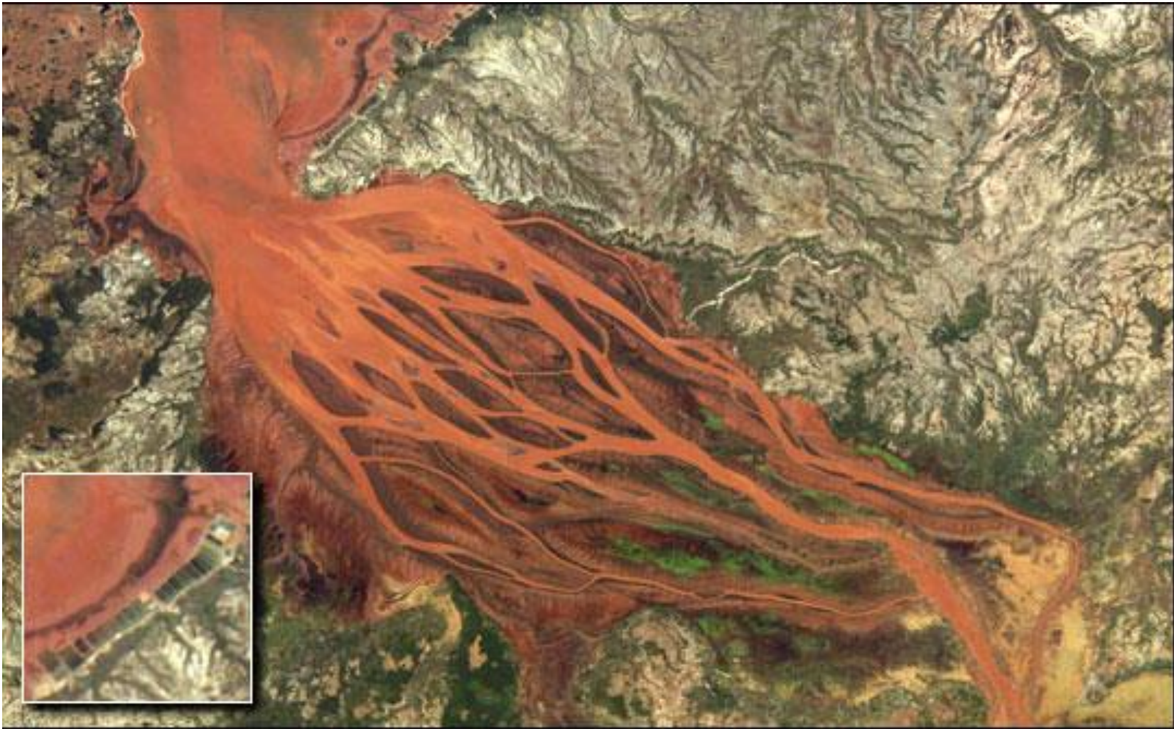
March 25, 2004 (ISS008-E-19233) - Betsiboka Estuary, Madagascar