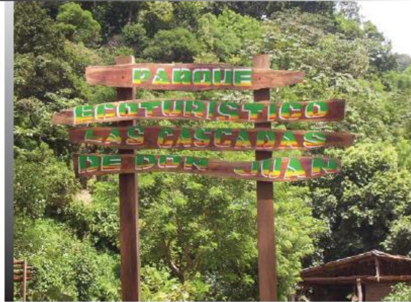
Iniciativa ecoturística en una finca de café en el municipio de Jujutla, departamento de Ahuachapán

Al tener las plantaciones de café, mayor cantidad de árboles, con presencia de distintas especies animales y vegetales, así como una gestión integral de las cuencas hidrográficas, se pueden fomentar iniciativas de turismo rural que ayuden a la educación ambiental.