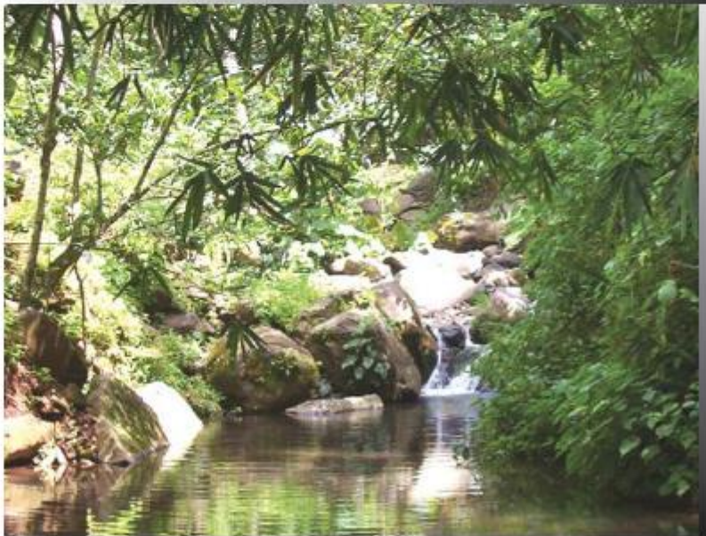
Iniciativa ecoturística en una finca de café en el municipio de Jujutla, departamento de Ahuachapán

Al tener las plantaciones de café, mayor cantidad de árboles, con presencia de distintas especies animales y vegetales, así como una gestión integral de las cuencas hidrográficas, se pueden fomentar iniciativas de turismo rural que ayuden a la educación ambiental.