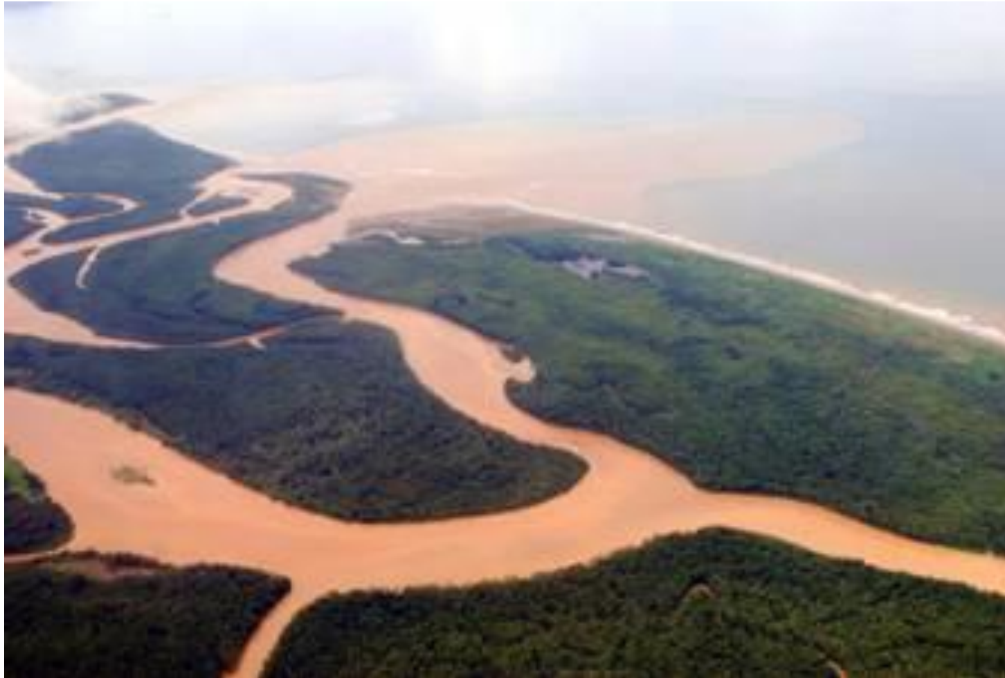
Desembocadura río Térraba, Costa Rica