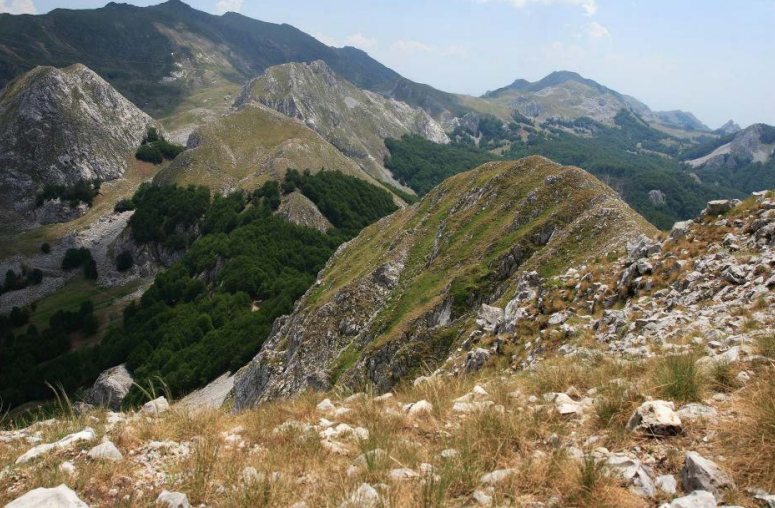
Parku Kombëtar Shebenik-Jabllanicë