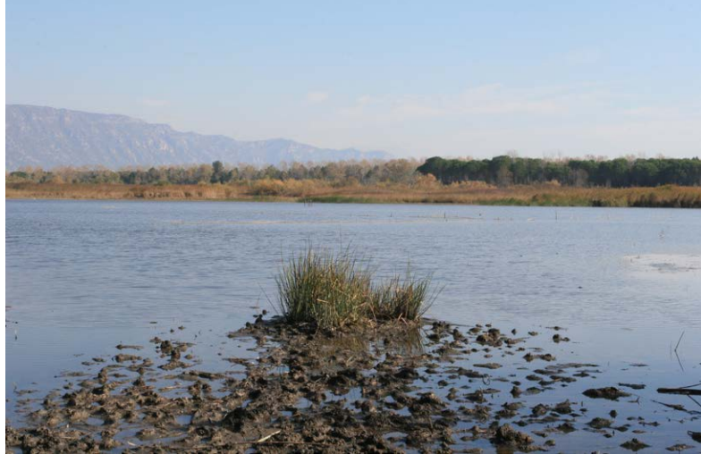
Peisazhi i Mbrojtur i Lumit Buna