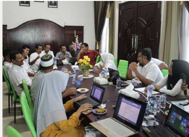
Foro de la Cuenca Hidrográfica de Peusangan (FDKP) en una reunión con el gobierno del distrito para revisar un plan espacial para la zonificación de arena y grava.

Después de sensibilizar a los líderes consuetudinarios sobre las regulaciones mineras, WWF Indonesia capacitó a las comunidades locales sobre cómo reportar casos de extracción ilegal a través del periodismo ciudadano. Con esta sabiduría local, las comunidades trabajan ahora en estrecha colaboración con el gobierno y las empresas locales, incluida la minería de arena y grava, una empresa de fertilizantes y una empresa local de agua, para garantizar el suministro de agua dulce, lo que también incluye su participación en un esquema de pago por servicios ecosistémicos (PES) administrado por el Foro de la Cuenca Hidrográfica. A medida que más miembros de la comunidad informaban sobre la situación, el gobierno mejoró la aplicación de la ley y revisó los planes espaciales del distrito, incorporando una zonificación específica para la extracción sostenible de arena y grava. Con esta zonificación, es más fácil controlar actividades ilegales y garantizar que los dueños de negocios legales cumplan con su licencia. Cuarenta y cinco empresas mineras ya están