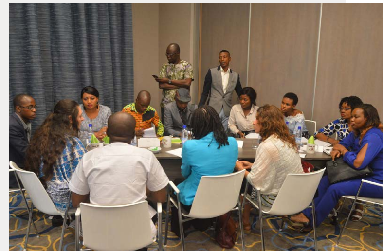
Las empresas se reúnen con las OSC en un Café RSE.

Consulte la Guía de recursos BioBiz Exchange de la UICN para una explicación más detallada sobre cómo definir la situación. 14