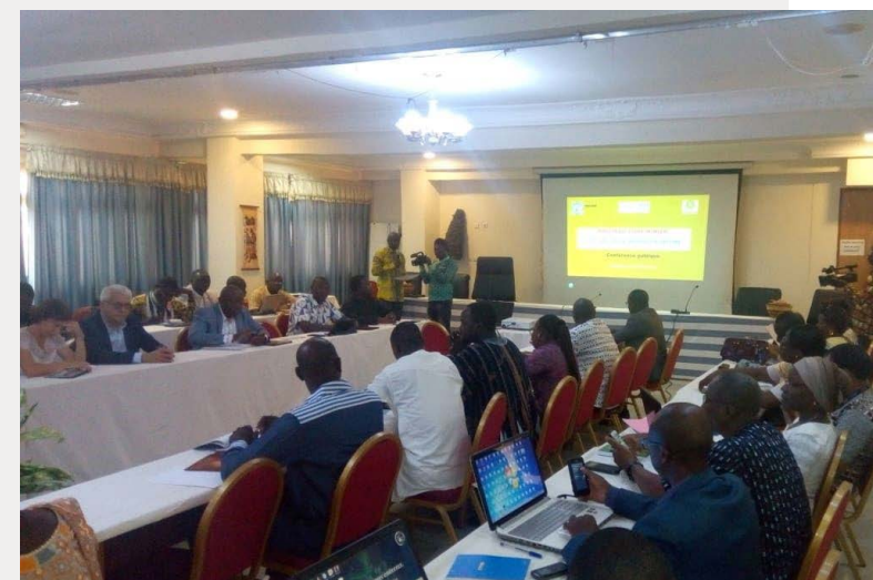
Una conferencia pública sobre la FMDL en Burkina Faso en 2018.

Aunque la campaña haya colaborado ampliamente con las partes interesadas y haya recibido mucha atención de medios de comunicación nacionales e internacionales, el gobierno todavía tiene la intención de extraer bauxita en Atewa. En respuesta, en enero de 2020, una coalición de ONG y ciudadanos particulares presentó una acción civil ante el Tribunal Superior de Jurisdicción General contra el Gobierno de Ghana, declarando que los proyectos en Atewa violaban el derecho a un medio ambiente seguro y saludable. 22 El Fiscal del Estado negó todas las acusaciones en su escrito de demanda bajo la Acción Civil de los demandantes y recomendó desestimar el caso. Se espera una decisión judicial en 2021. Ahora, la campaña está cambiando de nuevo hacia acciones internacionales, como la presentación de la Moción 103 23 sobre Atewa a la Asamblea de Miembros de la UICN. Esto se suma al compromiso de las OSC con los principales estándares mundiales de transparencia minera, rendición de cuentas y sostenibilidad que tienen como objetivo garantizar que el Bosque de la Cordillera de Atewa esté seguro, ahora y para el futuro, y que sus servicios de suministro de agua, mantenimiento de la biodiversidad y mejora del clima estén protegidos.