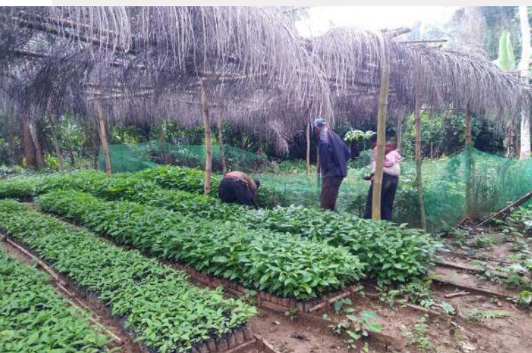
Algunos miembros de comunidades desarraigando las plántulas de un vivero para ser transportadas a un sitio de siembra.

Por ejemplo, Guinness Ghana Breweries PLC (Diageo) se enfrentó a una crisis de contaminación del agua y estaba interesada en proteger los recursos hídricos y los ecosistemas de la cuenca del Densu. A Rocha Ghana colaboró proactivamente con Guinness Ghana, proporcionó información sobre temas de seguridad hídrica y también organizó la participación de la empresa en una gira de estudios a Ecuador para que pudiera aprender más sobre las soluciones de