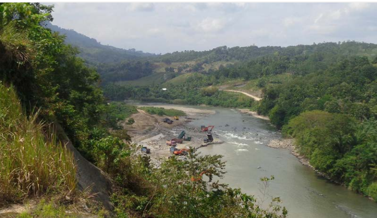
© Zainudin, líder consuetudinario - Importante explotación de arena y grava a lo largo del río.

Después de sensibilizar a los líderes consuetudinarios sobre las regulaciones mineras, WWF Indonesia capacitó a las comunidades locales sobre cómo reportar casos de extracción ilegal a través del periodismo ciudadano. Con esta sabiduría local, las comunidades trabajan ahora en estrecha colaboración con el gobierno y las empresas locales, incluida la minería de arena y grava, una empresa de fertilizantes y una empresa local de agua, para garantizar el suministro de agua dulce, lo que también incluye su participación en un esquema de pago por servicios ecosistémicos (PES) administrado por el Foro de la Cuenca Hidrográfica. A medida que más miembros de la comunidad informaban sobre la situación, el gobierno mejoró la aplicación de la ley y revisó los planes espaciales del distrito, incorporando una zonificación específica para la extracción sostenible de arena y grava. Con esta zonificación, es más fácil controlar actividades ilegales y garantizar que los dueños de negocios legales cumplan con su licencia. Cuarenta y cinco empresas mineras ya están