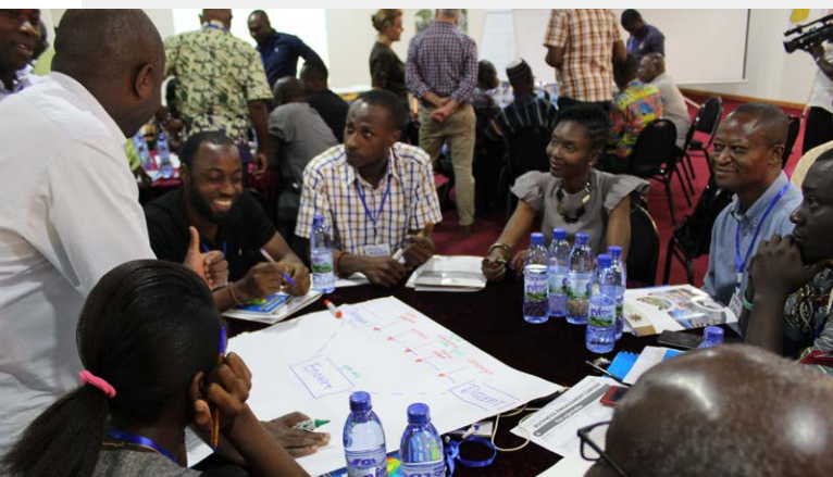
Formación SRJS en Ghana.

“Sin colaboración la acción legal no hubiera sido presentada, y las empresas y las OSC de Uganda no estarían colaborando de forma regular.” - Un representante de AFIEGO.