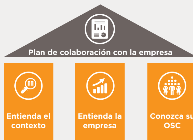
Figura 1: Representación de un plan de colaboración con una empresa – construir sobre bases sólidas

puede encontrar en el modelo disponible al final del documento (Tabla 1).