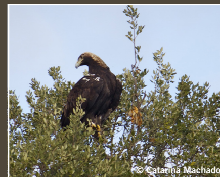
Aquila adalberti Águila imperial Aigle ibérique Spanish Imperial Eagle عقاب ملكي إسباني Vulnerable Vulnérable

De nombreux rapaces migrent sur de longues distances, traversant la péninsule ibérique, le Maroc et, dans une moindre mesure, l'Italie, l'Algérie et la Tunisie, sans se soucier des frontières géopolitiques établies par les êtres humains. C'est pourquoi leur conservation dépend de la réduction des menaces tout au long de leurs voies migratoires.