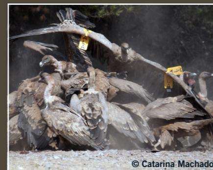
Gyps fulvus Buitre leonado Vautour fauve Griffon Vulture نسر أسمر Preocupación Menor Préoccupation mineure