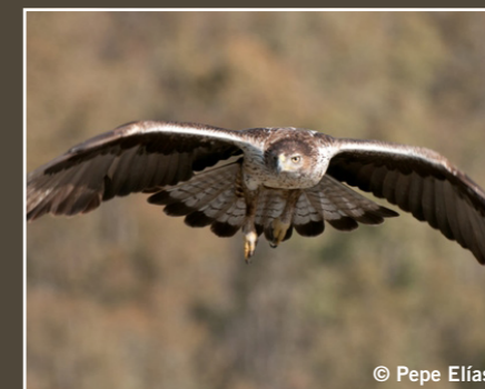
Aquila fasciata Águila-azor perdicera Aigle de Bonelli Bonelli's Eagle عقاب بونلي Preocupación Menor Préoccupation mineure