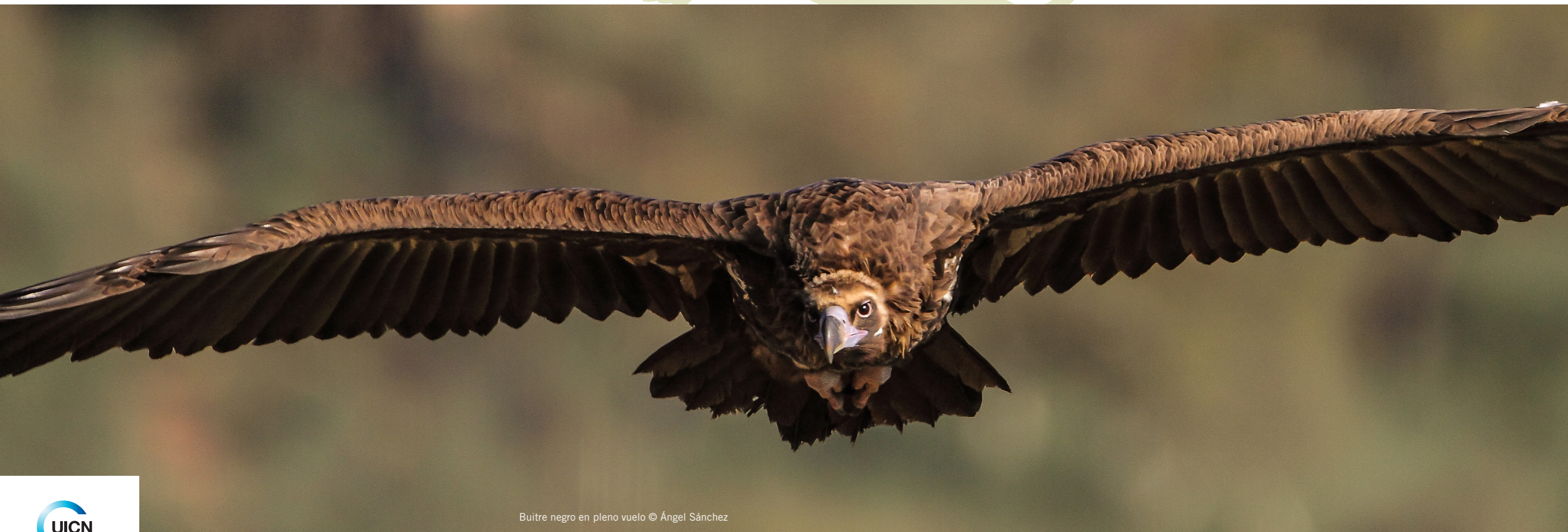
Buitre negro en pleno vuelo