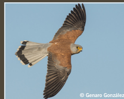
Falco naumanni Cernícalo primilla Faucon crécerellette Lesser Kestrel عويسق Preocupación Menor Préoccupation mineure