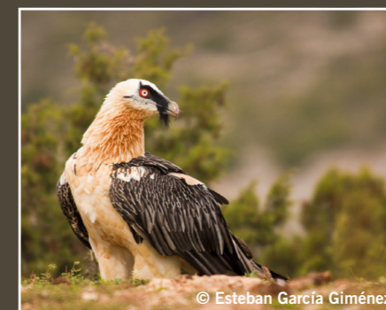
Gypaetus barbatus Quebrantahuesos Gypaète barbu Bearded Vulture نسر أبو ذقن Casi Amenazado Quasi menacé