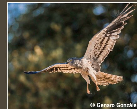
Circus pygargus Aguilucho cenizo Busard cendré Montagu's Harrier أبو شودة Preocupación Menor Préoccupation mineure