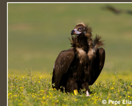
Aegypius monachus Buitre negro Vautour moine Cinereous Vulture نسر رمادي Casi Amenazado Quasi menacé