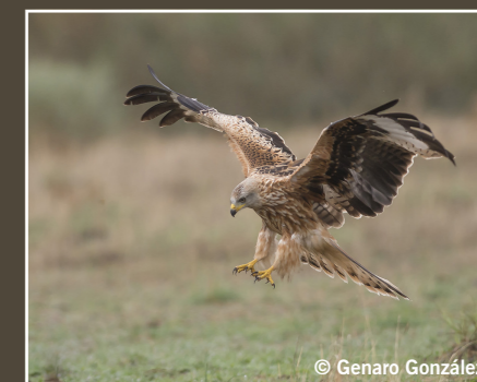
Milvus milvus Milano real Milan royal Red Kite حدأة حمراء Casi Amenazado Quasi menacé