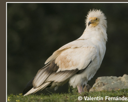
Neophron percnopterus Alimoche Vautour percnoptère Egyptian Vulture رخمة مصرية En Peligro En danger