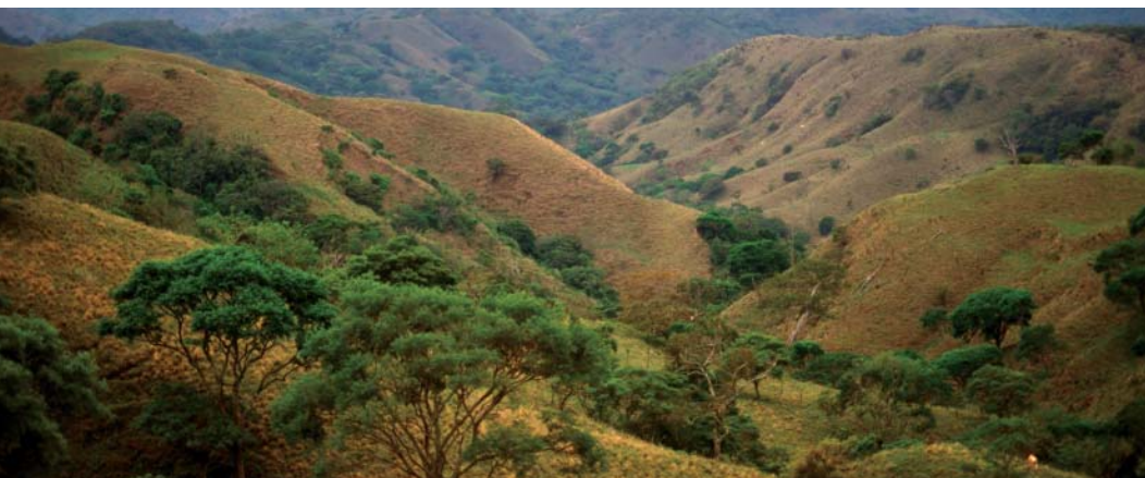
UICN © Ger Bergkamp, Costa Rica

La déforestation et la dégradation des forêts contribuent à près de 20% des émissions anthropogéniques de gaz à effet de serre au niveau international. Une faible gouvernance des forêts et la marginalisation des communautés dépendantes des forêts sont d'importants facteurs qui exacerbent la perte des forêts et leur dégradation. Tant que ces problèmes ne seront pas résolus, le succès de REDD est incertain et les mécanismes de REDD pourraient même renforcer la corruption, vulnérabiliser les droits des communautés locales et menacer la diversité biologique forestière.