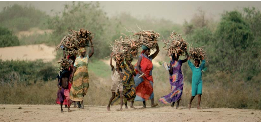
UICN © Elroy Bos, Senegal Photo de couverture : UICN © Jim Thorsell, Senegal

Pour plus d'informations, veuillez contacter : Stewart Maginnis: stewart.maginnis@iucn.org Programme de conservation des forêts de l'UICN Joshua Bishop: joshua.bishop@iucn.org Environnement et économie IUCN