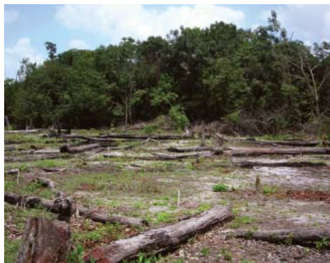
UICN © Michelle Laurie, Guyana

D'importantes réductions des émissions de gaz à effet de serre au niveau international sont nécessaires afin d'éviter des changements climatiques désastreux. L'UICN est convaincue que la réduction des émissions issues de la déforestation et de la dégradation (REDD), peut contribuer d'une façon importante à la mitigation des changements climatiques, si REDD est basée sur une gestion durable des forêts et intégrée à des stratégies globales de réduction d'émissions de carbone.